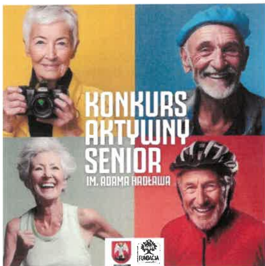
Współpraca z Fundacją im. Adama Hadława przy realizacji Konkursu „Aktywny Senior im. Adama Hadława. Edycja 2023”