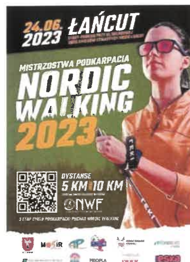
Projekt graficzny plakatu Mistrzostw Podkarpacia Nordic Walking (Stowarzyszenie Kultury Sportowej „Aktywne Podkarpacie”)