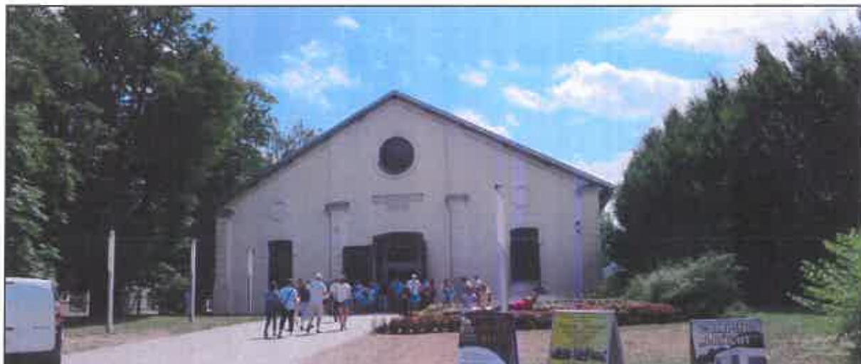
Dawny Maneż wojskowy, zw. Reitschule