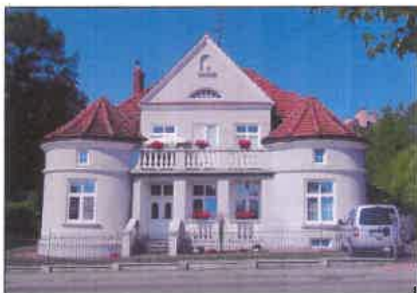
Willa Oleńskich, ul. Żardeckiego