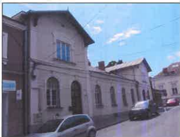
Dawna łaźnia żydowska, ul. Ottona z Pilczy

Późniejsze to obiekty w zespole koszar kawaleryjskich przy ul. Piłsudskiego – budynek administracyjny i budynek główny koszar, ponadto kasyno z XIX/XX w. przy ul. Kościuszki 2,, budynek sądu przy ul. Grunwaldzkiej z l. 1910-13 projektu Antoniego Dąbrowskiego – głównego budowniczego Ordynacji Dóbr Łańcuckich, oraz dawna łaźnia żydowska wybudowana ok. 1910 r. na gruntach gminy izraelickiej przy ul. Ottona z Pilczy 2.