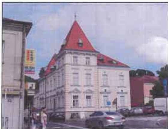
Dawne Kasyno Urzędnicze, ul. Kościuszki