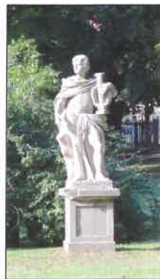
Fragment oranżerii i zamku oraz rzeźba Apolla w parku zamkowym