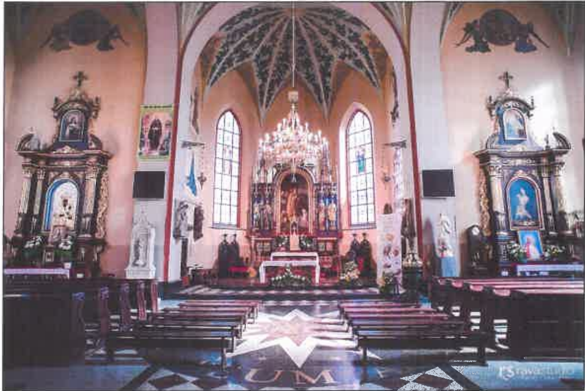
Wnętrze kościoła farnego

Intersujący, duży zespół dzieł rzemiosła artystycznego stanowią szaty liturgiczne, głównie ornaty z okresu od XVII do pocz. XX w. (łącznie 33 szt.) i dalmatyka, co nie jest tak często spotykane.