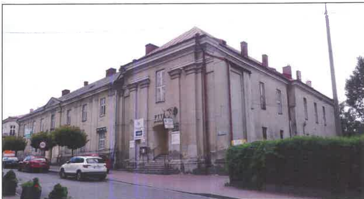
Dawny Zespół kościelno-klasztorny oo. dominikanów

przekształcone i przebudowane, najpierw po 1820 r. na potrzeby koszar, następnie w 1910 r. na szpital wojskowy i w 1966 r. na Dom Wypoczynkowy posiada olbrzymie znaczenie w układzie przestrzennym, krajobrazie miasta, dziejach miasta i samego konwentu dominikańskiego (był to drugi dom tego zgromadzenia na terenie ówczesnej diecezji przemyskiej), placówka misyjna i „przyczółek” akcji latynizacyjnej na prawosławnych ziemiach ruskich).