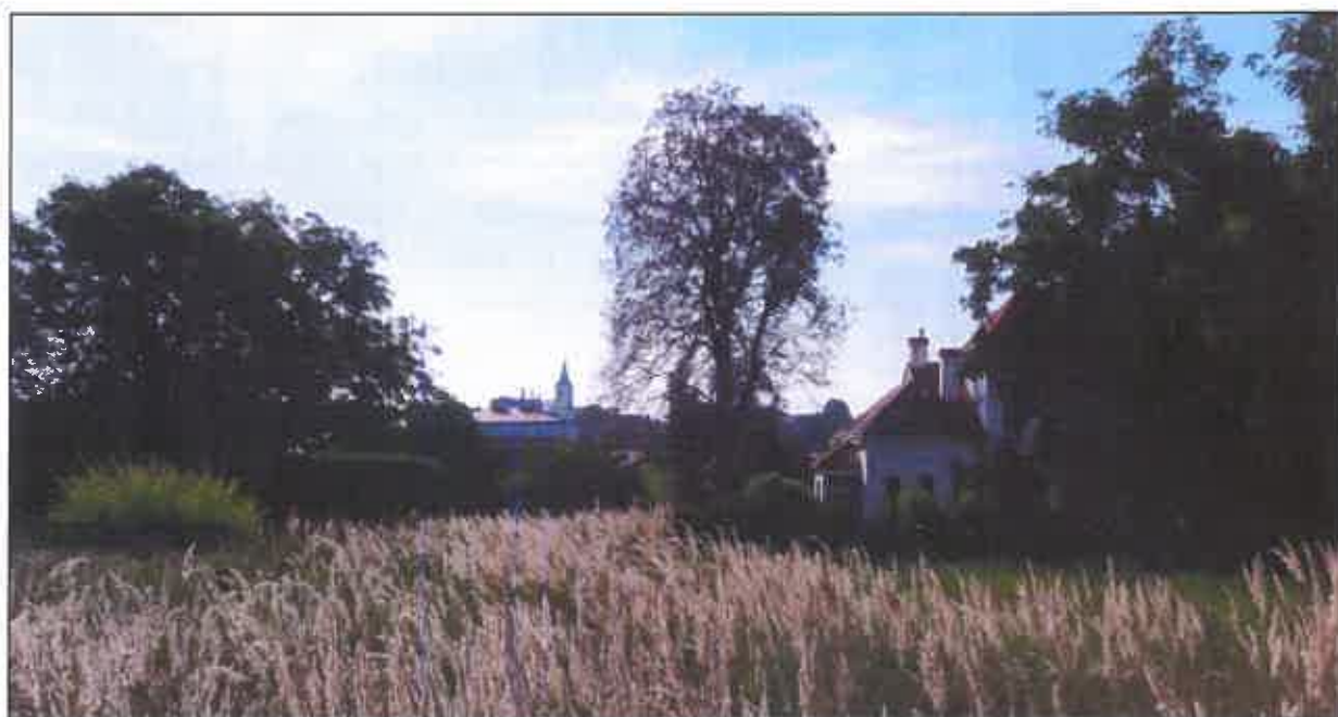
Widok na kościół farny z ul. Wyszyńskiego