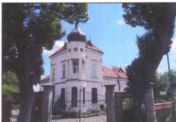
Willa Kulickowskich, ul. Bohaterów

Na drugim miejscu uplasował się zasób zabytkowej zieleni , co jednocześnie potwierdza duże znaczenie parków i alei w strukturze przestrzennej, krajobrazie i panoramie miasta. Główną rolę odgrywa park zamkowy, złożony z dwóch zespołów: parku wewnętrznego w obrębie wałów i parku angielskiego na zewnątrz fortyfikacji, założonego w l. 70. i 80. XVIII w., powiększanego i przekształcanego, uzupełnianego i dostosowywanego do nowych ogrodowych tendencji stylowych i potrzeb właścicieli na przełomie XIX i XX w. Poza parkiem ważną rolę w krajobrazie kulturowym miasta, odgrywają: Bażantarnia oraz aleje łączące rezydencję z folwarkami założone w XVIII i XIX w., m. in.: grabowo-kasztanowa przy ul. Piekarskiej, kasztanowa podsadzana głogiem przy ul. Kasprowicza, dębowa podsadzana grabem i głogiem przy ul. Krasieńskiego, lipowa przy ul. Reja i Sikorskiego (d. ul. Lumumby), jesionowe przy ul. Kopernika, ul. Sobieskiego, ul. Orzeszkowej, jesionowe przy ul. Sowińskiego i ul. Kopernika, jesionowa podsadzana suchodrzewem przy ul. Kazimierza Wielkiego,