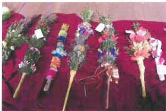
Na wielkanocnym jarmarku

Przejawem niematerialnego dziedzictwa są praktyki religijne – Wielkanoc, Boże Ciało, Boże Narodzenie – i związane z nimi tradycyjne obrzędy (np. straże grobowe, procesje) oraz specyficzne dla miasta i okolic potrawy. Można je poznać nie tylko w prywatnych domach, ale też na organizowanych coraz chętniej jarmarkach.