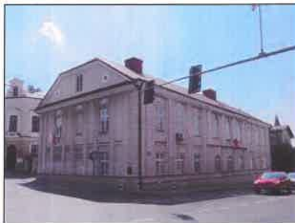
Dawny Zajazd poczty konnej, ul. Piłsudskiego