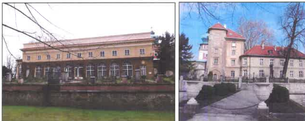
Oranżeria i most prowadzący do zamku od południa

Trzecią pod względem ilościowym grupę zabytków stanowią obiekty określone mianem: inne , zatem wszystkie, którym trudniej przypisać standardową i powszechnie przyjętą typologię. Stąd też ta grupa jest tak zróżnicowana.