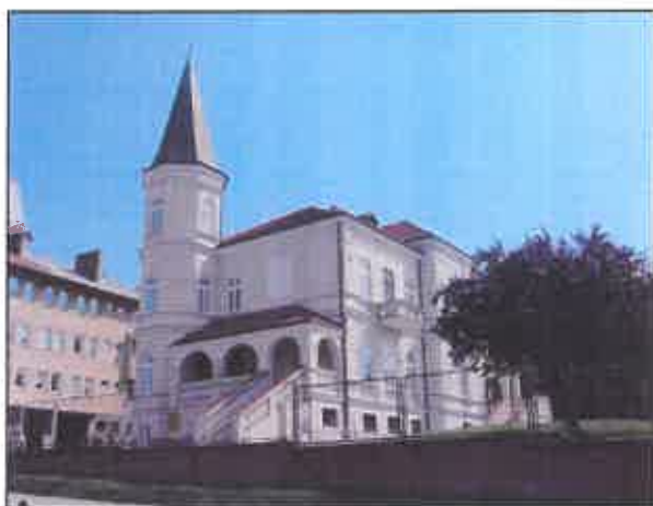
Willa Duża Reichardówka, ul. Piłsudskiego

Ebenezera Howarda, aczkolwiek rozbieżnymi nieco ideowo od angielskich koncepcji. Nie zmienia to faktu, że wille, domy i nieliczne dworki otoczone ogrodami, zarówno murowane jak i drewniane stanowią ważny aspekt w polityce ochrony konserwatorskiej dziedzictwa kulturowego Łańcuta, ale też w budowaniu marki „Łańcut” i traktowaniu tejże zabudowy jako wyróżnika tożsamości miejskiej.