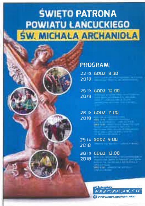
Plakaty promujące wydarzenia związane z łańcuckimi tradycjami