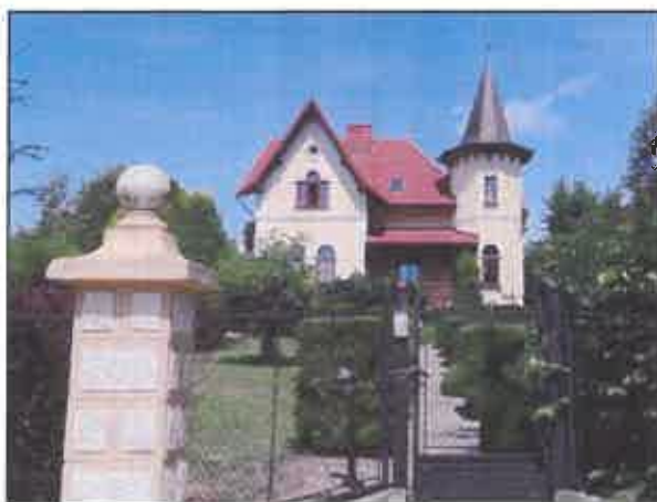
Willa Cetnarskiego, ul. Konopnickiej

Wiele spośród tych zabytków posiada wartości kwalifikujące je do wpisu do rejestru zabytków. Na uwagę zasługują przede wszystkim wille i domy w ogrodach, które stanowią o specyfice łańcuckiej zabudowy. Najwięcej znajduje się przy ulicach: Cetnarskiego, Danielewicza, Daszyńskiego, Farnej, Słowackiego, Grunwaldzkiej, Konopnickiej, Kraszewskiego, 29 Listopada, Mickiewicza, Moniuszki, Mościckiego, Pozwierzyniec, Tkackiej, Wałowej i Wąskiej. Zasób zabudowy mieszkalnej powiększają mieszczańskie kamienice, głównie w Rynku i Pl. Sobieskiego, przy ulicach: 3 Maja, Ottona z Pilczy, Piłsudskiego, Rzeźniczej, Słowackiego.