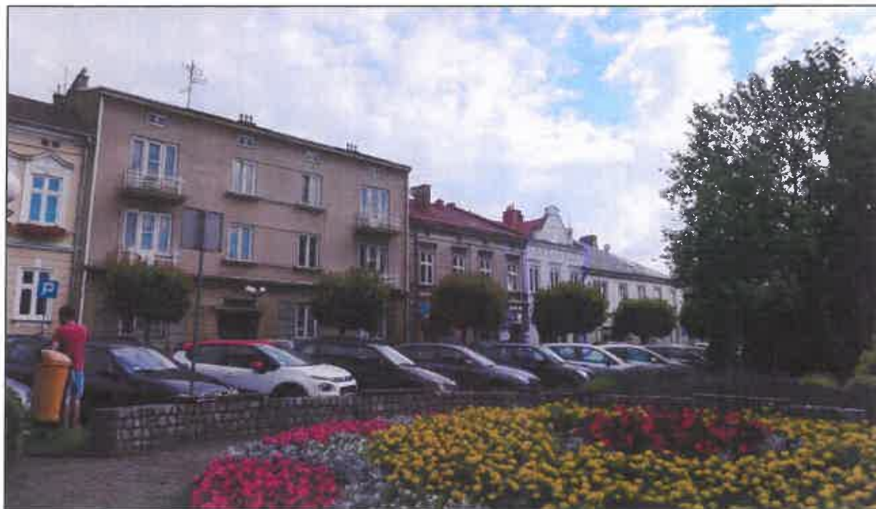
Zabudowa południowej pierzei Placu Sobieskiego

Ważnym dla krajobrazu kulturowego miasta elementem są obiekty małej architektury, związane z kultem religijnym. Krzyże i kapliczki Łańcuta będące obiektem troski mieszkańców i miejscem modlitwy, upamiętniają fundatorów i wydarzenia związane z historią miasta m.in. przy ulicach: Dolniańskiej, Dominikańskiej, Grunwaldzkiej, Kościuszki, 29 Listopada, Słowackiego i kard. Wyszyńskiego.