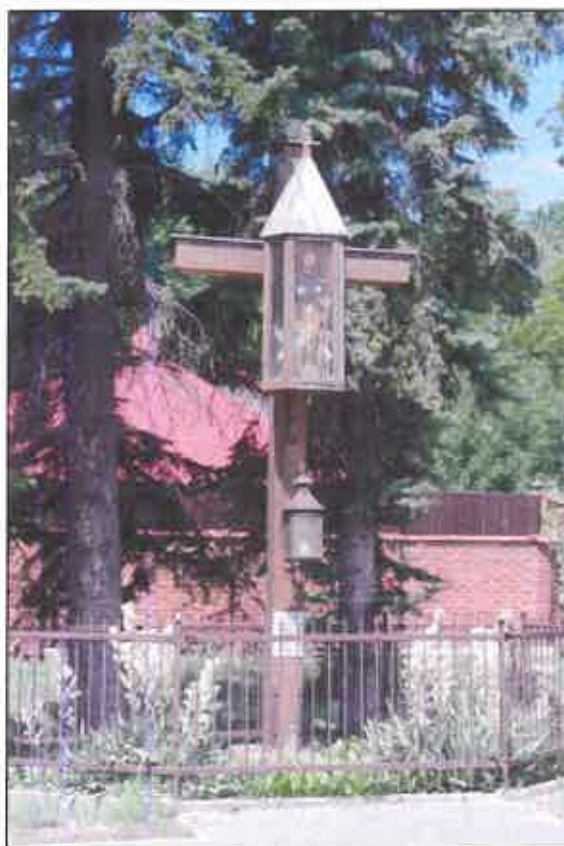
Krzyż św. Rocha, ul. Grunwaldzka

Ważną rolę w mieście, jego historii i przestrzeni odgrywają relikty obwarowań miasta – pozostałości wałów ziemnych i fos przy ul. Wałowej i Podwalu oraz zespoły zieleni, m.in. Dębnik, obecnie las komunalny, chociaż w dużym stopniu zaniedbany i zdegradowany. Założenie Dębnika łączy się z datą 1758 r., tj. wydania przez Lubomirskiego dekretu, w którym nowożeńcy zobowiązani byli do zasadzenia drzewka dębu. Obszar ten posiada poza wartościami historycznymi, walory krajobrazowe i rekreacyjne.