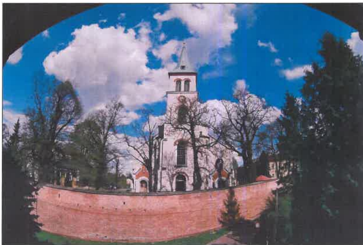
Kościół pw. św. Stanisława, Biskupa i Męczennika

Nieco mniejszy zespół stanowią zabytki sakralne , ale posiadają wyjątkowe wartości historyczne, architektoniczne, artystyczne i krajobrazowe. Listę obiektów otwiera kościół parafialny pw. św. Stanisława, Biskupa i Męczennika,, którego bryła i forma są wynikiem przebudowy z końca XIX w., ale bogata historia, sięgająca XIV w., benefektorzy, działający w nim architekci, budowniczości i artyści dodają splendoru i wzbogacają jego zabytkowe wartości.