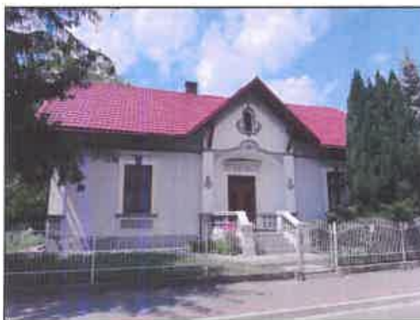
Dom Pelca, ul. Grunwaldzka