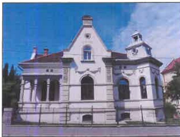
Willa Zacisze, ul. Grunwaldzka