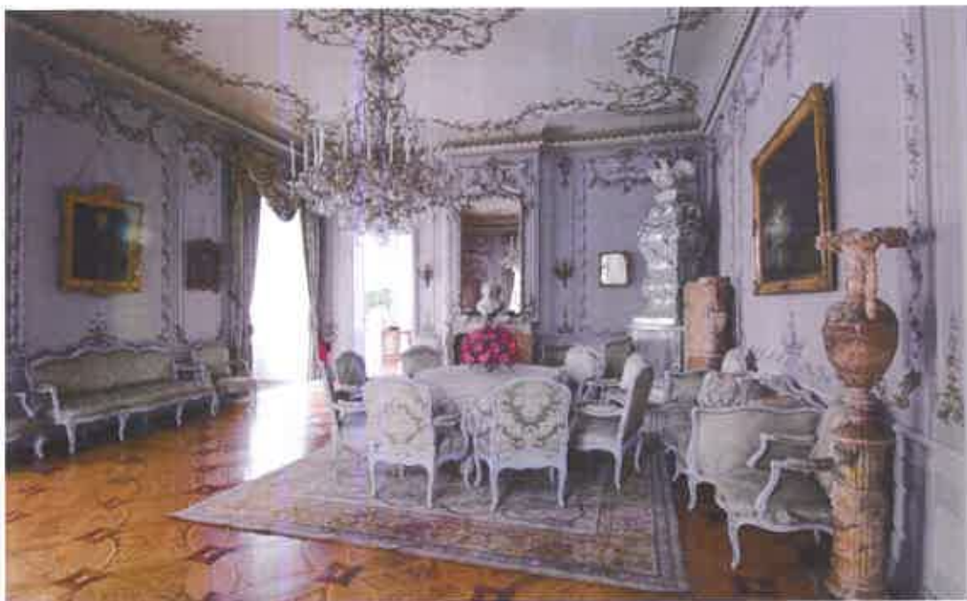
Wnętrze zamku z oryginalnym wystrojem i wyposażeniem

Zdecydowanie większy zasób ruchomości stanowią muzealia zgromadzone w Muzeum-Zamku w Łańcucie. Ten olbrzymi zbiór dzieł sztuki, w większości złożony z oryginalnych elementów wyposażenia rezydencji obejmuje tysiące obiektów: obrazów (ok. 600), rysunków i akwarel (ok. 220), grafik (ok. 2500), rzeźb (ok. 500), mebli (ponad 2000), instrumentów muzycznych (ok. 18), sreber (ok. 1300), zegarów (ok. 60), ceramiki i szkła (ponad 3800), tkanin (ok. 300) 20 . Poza nimi setki militariów, medali i pieczęci, przyborów kominkowych, judaików, teatraliów i przedmiotów codziennego użytku. Zasób ten wzbogaca unikatowa kolekcja powozów, bogaty księgozbiór starodruków i setki fotografii. Wyjątkową wartość w skali ogólnopolskiej prezentuje Dział Sztuki Cerkiewnej z niezwykle cennym zbiorem ikon.