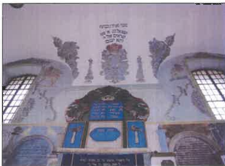
Malowidła ścienna oraz bima w synagodze

Część ruchomaliów podlega ochronie poprzez wpis do rejestru zabytków nieruchomych, a z uwagi na wartość tychże obiektów należy zwrócić na nie uwagę, a mianowicie na rzeźby w parku zamkowym oraz wyposażenie i wystrój łańcuckiej synagogi.