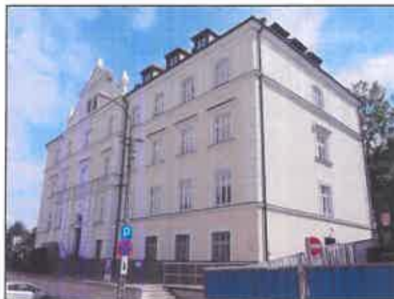
Budynek sądu, ul. Grunwaldzka

Nieco mniejszy zespół stanowią zabytki sakralne , ale posiadają wyjątkowe wartości historyczne, architektoniczne, artystyczne i krajobrazowe. Listę obiektów otwiera kościół parafialny pw. św. Stanisława, Biskupa i Męczennika,, którego bryła i forma są wynikiem przebudowy z końca XIX w., ale bogata historia, sięgająca XIV w., benefektorzy, działający w nim architekci, budowniczości i artyści dodają splendoru i wzbogacają jego zabytkowe wartości.