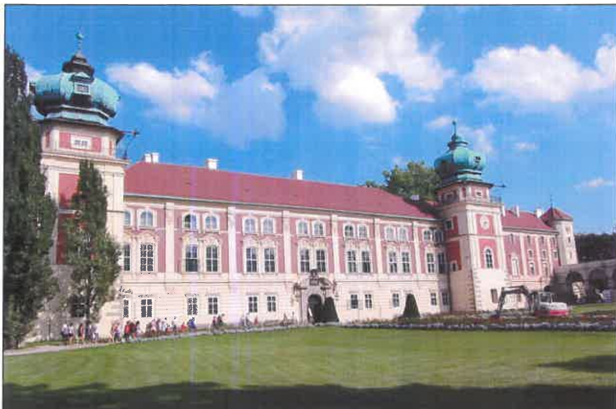
Zamek, elewacja frontowa

wyjatkowe wartości historyczne, artystyczne i naukowe został decyzją Prezydenta RP z 25 sierpnia 2005 (Dz. U. 2005 nr 167 poz. 1402). wpisany na prestiżową listę pomników historii pod nazwą "Łańcut – zespół zamkowo-parkowy".