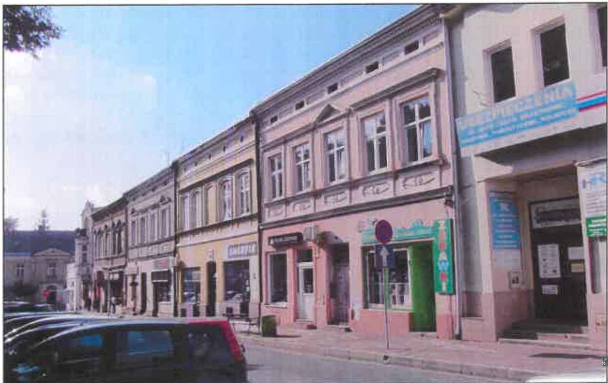
Zabudowa północnej pierzei Rynku

Dawny budynek Kasy Zaliczkowo-Zapomogowej przy ul. Mickiewicza 2, dawny Żydowski Dom Ludowy przy ul. Ottona z Pilczy 12, dawna siedziba Stowarzyszenia Mieszczan „Gwiazda” przy ul. Danielewicza 8. Dość liczny zespół stanowią także budynki dawnego Zespołu Koszar 10 Pułku Strzelców Konnych przy ul. Piłsudskiego.