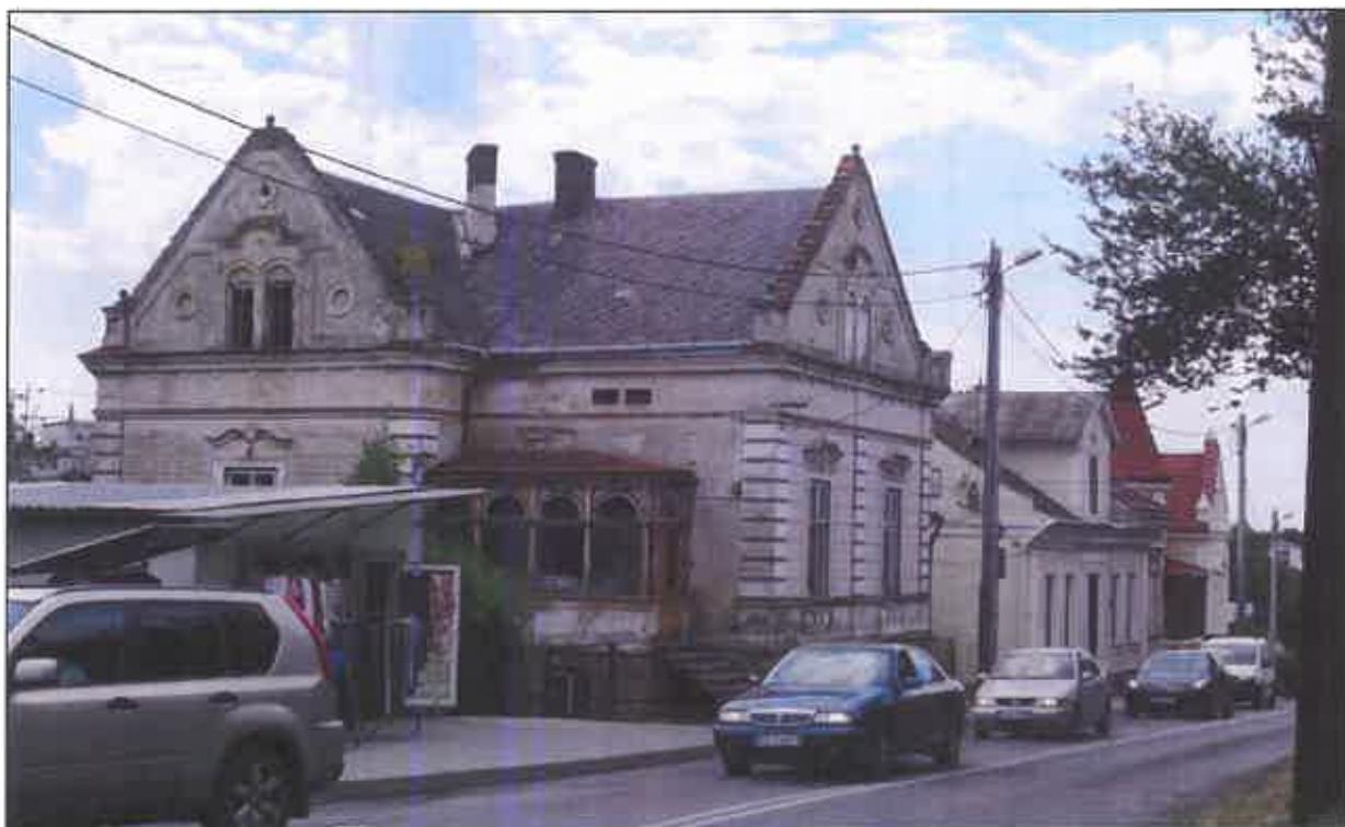
Fragment zabudowy ul. Cetnarskiego

Mieszkańskie kamienice zbudowane są na nowożytnych fundamentach, albo odbudowane z wykorzystaniem ich ścian w 2 ćw. XIX w. po pożarze miasta w 1820 r.; chociaż skromniejsze od pierwotnej zabudowy zachowują układ przestrzenny z XVII, czy XVIII w. Nowe kamienice z 2 poł. XIX czy pocz. XX w., zarówno te w Rynku jak i w zawartej zabudowie okolicznych ulic (m. in. Cetnarskiego, Danielewicza, 3-go Maja, Rzeźniczej, Pl. Sobieskiego) są odzwierciedleniem tendencji budowlanych okresu autonomii galicyjskiej małych miast. To kamienice kalenicowe, dwukondygnacyjne, zwykle z trzytraktowym układem wewnątrz dostosowanym w parterze do celów handlowo-usługowych, ze skromną eklektyczną lub historyzującą dekoracją fasad. W tej grupie zabytków wyróżniają się przede wszystkim wille i domy w ogrodzie, Dlatego też ich ochrona i opieka powinna skupiać uwagę zarówno właścicieli jak i pozostałych interesariuszy, władze samorządowe i lokalne stowarzyszenia, które stanowią o specyfice zabudowy Łańcuta i nieprzeciętnym krajobrazie miasta.